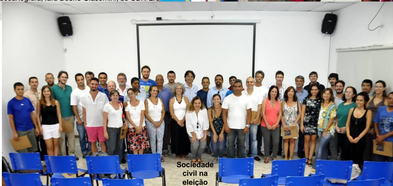
Sociedade civil na eleição