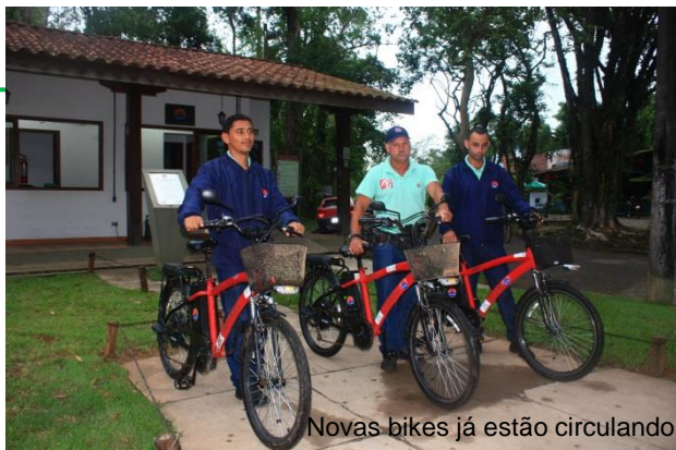
Novas bikes já estão circulando

3 - Recuperação da avenida – Diante das dificuldades na continuidade dos trabalhos da Comissão de Melhoria da Avenida, foi apresentada proposta, pela própria comissão, para sua dissolução. Assunto bastante polêmico, com diversas discussões. Sem que se conseguisse montar um novo grupo de trabalho para continuidade da obra, ficou confirmada sua dissolução. Foi decidido que será terminada a primeira fase - restauração de guias e sarjetas. Nova AGE será convocada para mais uma tentativa de formação de grupo de trabalho específico para este fim.