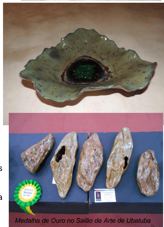
Medalha de Ouro no Salão de Arte de Ubatuba