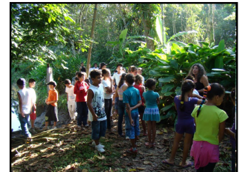
Crianças vão conhecer a natureza de perto