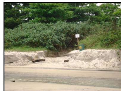
Mudanças no leito do rio causam erosão

Vale lembrar que há muitos anos, este mesmo rio sofreu algumas tentativas fracassadas de canalização por alguns empreendedores, mas o rio ultrapassou as barreiras construídas voltando a correr para a praia, tanto que hoje ainda há parte de um muro sem utilidade no canto esquerdo da praia, próximo as pedras.