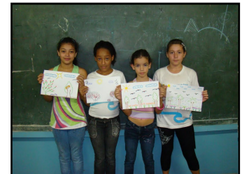
Alunos mostram seus trabalhos

Saiba mais sobre o projeto e sua metodologia no blog do PGA: http://pgaitamambuca.blogspot.com