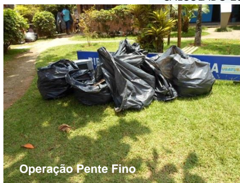
Operação Pente Fino

Entre em contato conosco Sede da SAI (012) 3845-3156 Base Comunitária (012) 3845-1098