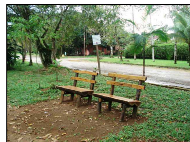
Bancos instalados na trilha da Avenida

Quem esteve em Itamambuca nos últimos meses pode notar que a trilha localizada no canteiro central da Avenida Itamambuca passou por algumas melhorias. Além do caminho que foi todo limpo, algumas plantas foram remanejadas para proporcionar melhor circulação das pessoas que ali fazem suas caminhadas. A SAI entende este como sendo um espaço de lazer e contato com a natureza, principalmente com as diversas espécies nativas de plantas e pássaros que ali se pode observar. Para aqueles que apenas querem curtir a fauna e a flora ou descansar de seus exercícios físicos, foram instalados bancos em diversos pontos ao longo de todo o trajeto. Uma série de outras melhorias estão programadas para este espaço, inclusive a retirada dos bags coletores de lixo reciclável que devem ser remanejados para um ponto de coleta central, tornando a trilha ainda mais agradável.