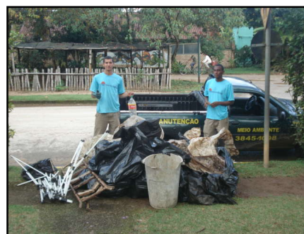
Muito lixo recolhido pela equipe da SAI

Ao final do período de férias, nos dias 28 e 29 de Julho, nossos funcionários fizeram um novo arrastão pelas ruas do loteamento e infelizmente o resultado não foi muito diferente do obtido na primeira limpeza: encontramos muito lixo espalhado. Foram recolhidos os mais diversos resíduos que encheram cerca de 34 sacos de 100 litros.