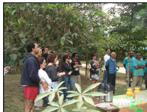
Publico comparece na inauguração