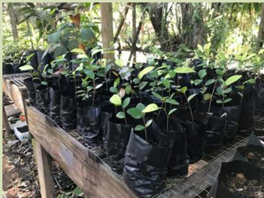
Mudas à espera de plantio no viveiro da SAI

Você sabia que as sementes germinam nas folhas deixadas nos pés das árvores? Essas mudas são transportadas para nosso viveiro e posteriormente plantadas ao longo do loteamento.