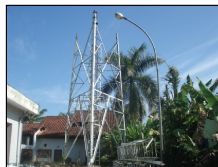
Antena da Rua 0 sendo desmontada

Mais uma vez a SAI agradece o empenho do escritório FELBERG ADVOGADOS ASSOCIADOS, o qual dedicou seu tempo e recursos de maneira voluntária ao longo desses anos, trabalhando arduamente pela vitória neste processo.