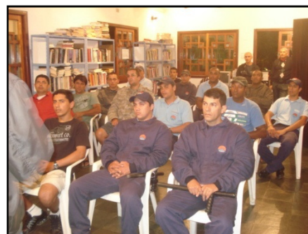
Equipe da SAI atenta ao treinamento