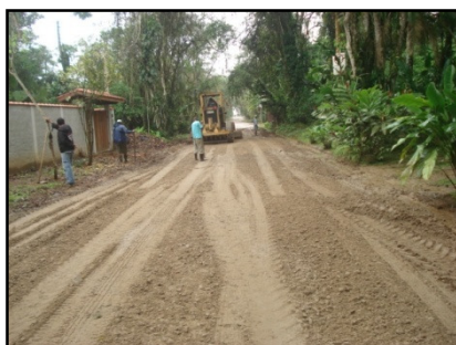
Máquinas da Prefeitura trabalham na Rua 19