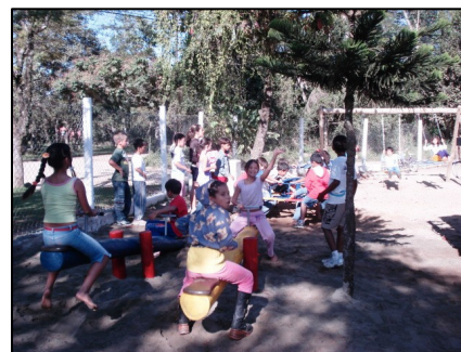
Crianças brincam na inauguração do playground

Convidamos todos os associados a participarem de iniciativas como essa que trazem benefícios a toda a comunidade de Itamambuca.