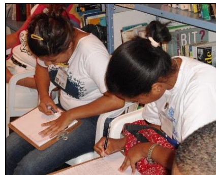
Jovens do projeto na Biblioteca Comunitária

A programação é que, até o final do ano, já circule o primeiro produto das oficinas: um informativo virtual, com um apanhado das atividades realizadas até agora.