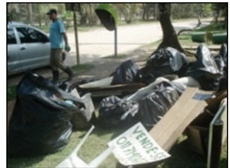
Lixo coletado no último pente-fino

Com esta iniciativa, a SAI ajuda Itamambuca a se tornar um exemplo, reduzindo os níveis de lixo com destinação inadequada próximos a zero.