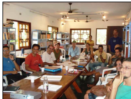
Plano de Gestão Ambiental é discutido na SAI

No último dia 07 de março reuniram-se junto à diretoria e associados na sede da SAI, membros do Comitê de Bacias Hidrográficas do Litoral Norte, biólogos, educadores, arquitetos, empreendedores ambientais, representantes do Itamambuca Eco Resort e demais interessados para discussão da elaboração de um Plano de Gestão Ambiental para Itamambuca. A idéia do plano, que surgiu de iniciativa em conjunto com a CETESB, é apresentar soluções práticas para os problemas de saneamento e qualidade das águas, preservação e recuperação da fauna e flora, destinação de resíduos e educação ambiental em Itamambuca. O plano servirá como base para captação de recursos junto a FEHIDRO, Prefeitura Municipal de Ubatuba bem como a iniciativa privada para realização de diversos projetos voltados para cada tipo de problema apontado. Foram diversas idéias debatidas e diferentes maneiras de colaboração apresentadas.