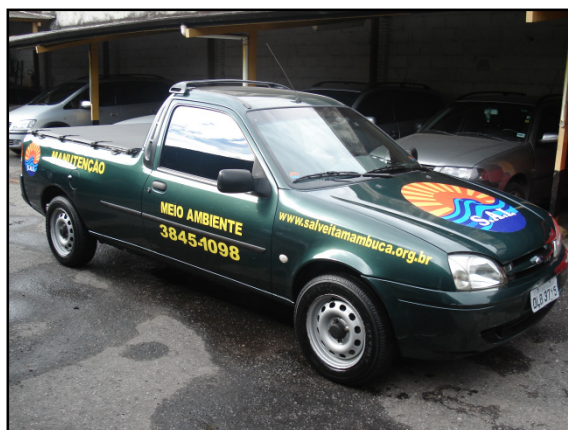
Nosso novo veículo já caracterizado com o logotipo da SAI

É com grande satisfação que anunciamos que finalmente foi concretizada a compra da picape prevista em nosso orçamento desde o ano passado.