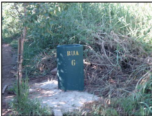
Nova modelo da lixeira dos balões