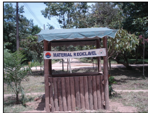
Nova estação coletora de lixo reciclável

Dentro do nosso compromisso de manter Itamambuca sempre limpa, renovamos no último mês todas as lixeiras localizadas nos balões de acesso a praia. Os antigos latões já estavam degradados e muitos freqüentadores vinham jogando o lixo no chão ao saírem da praia. Optamos pela instalação de manilhas de cimento como as que mantemos na praia, devido a maior durabilidade e custo mais acessível.