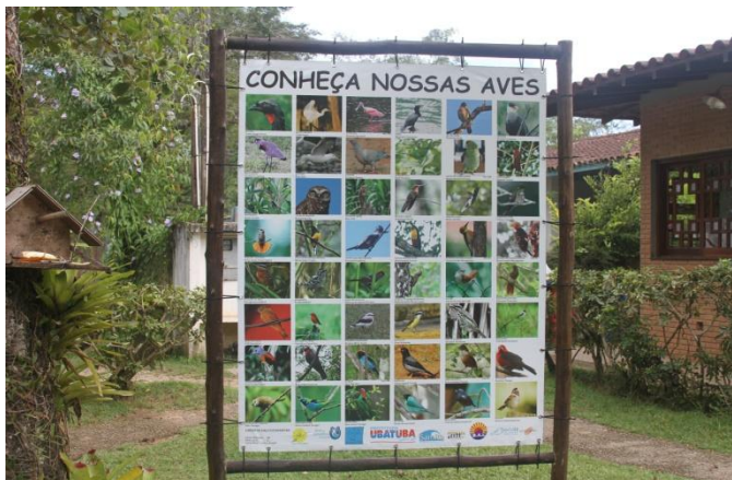
Painel elaborado por Carlos Rizzo - Ornitólogo