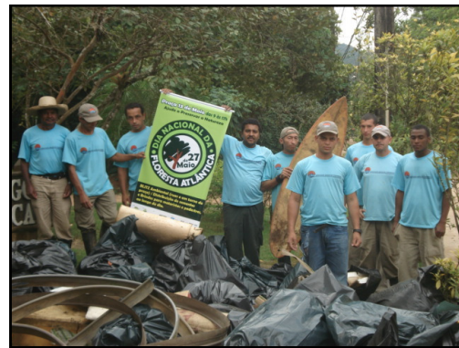
Equipe da SAI faz pente-fino em Itamambuca

Como parte das atividades do Dia Nacional da Floresta Atlantica, a equipe de manutencao da SAI realizou nos dias 02 e 03/06/2011, mais uma operacao pente-fino na praia, areas verdes, ruas e terrenos do loteamento. Foram recolhidas as seguintes quantidades de lixo e microlixo: 3 sacos de 100 litros (praia); 28 sacos de 100 litros (das ruas, areas verdes e terrenos do loteamento), alem de objetos como 1 cama, 1 cadeira de praia, 3 travesseiros, 1 prancha e 1 pneu. Lembramos mais uma vez a todos que procurem a destinacao correta a seus residuos, evitando deixa-los no ambiente.