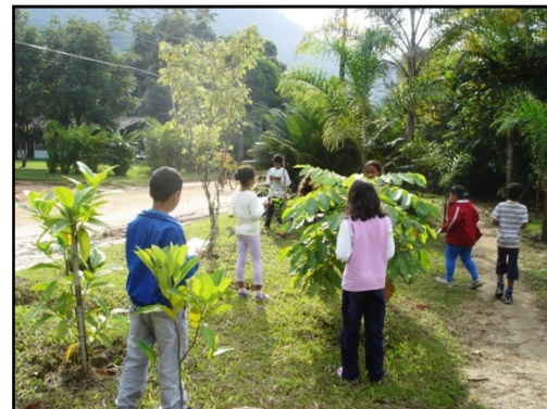
Crianças inspecionam as mudas em Itamambuca

Participaram cerca de 60 alunos da Escola Municipal Honor Figueira que através de uma ficha de monitoramento ilustrada e bastante didática fizeram o levantamento uma a uma das mudas plantadas. A ficha foi produzida com papel 100% reciclado, direto da Oficina de Papel - Programa de Inclusão Social do Projeto Tamar.