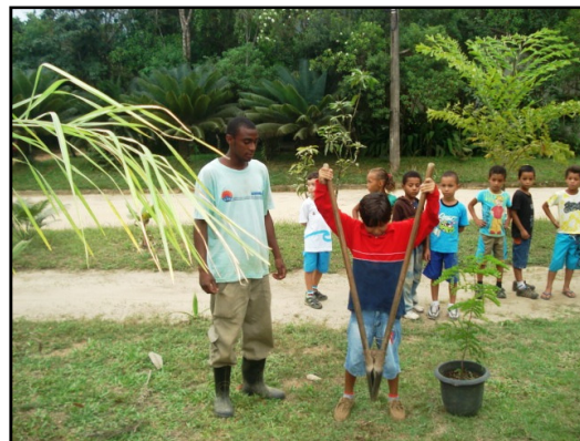
Crianças e funcionário da SAI plantam muda

As mudas foram doadas pela Secretaria Municipal de Meio Ambiente de Ubatuba - SEMA, por meio de um acordo efetuado entre SAI, PGA, SEMA e os realizadores do Brasil Surf Pro, os primeiros a aderir ao programa de compensação ambiental proposto pelo PGA para a realização de campeonatos de surf em Itamambuca. Embora muito importantes para fomentar a prática do esporte, esses eventos, quando mal dimensionados, geram diversos impactos ambientais. A começar pelos palanques montados na areia, que podem danificar o jundu, vegetação nativa rasteira, cujas raízes profundas ajudam a evitar a erosão das praias.