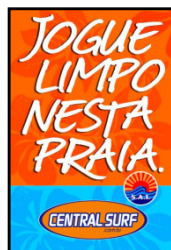
Cartaz da Campanha

A Central Surf em parceria com a SAI marcou presença durante todo o verão na praia de Itamambuca. Essa parceria consistiu na distribuição de sacolas 100% degradáveis e folhetos falando sobre a importância em respeitar o ambiente que você frequenta e outras pessoas vivem. Além disso, a Central Surf forneceu o uniforme para o pessoal da manutenção da SAI, que faz a limpeza da praia.