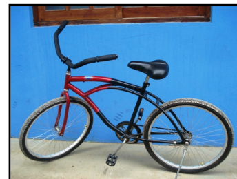
Registro das doações recebidas na sede da SAI durante o último mês

Dúvidas, críticas ou sugestões? Quer ter seu texto publicado? Mande um e-mail para samigos@uol.com.br SAI - Associação Amigos de Itamambuca - Av. Itamambuca, 1021 - CEP: 11680-000 - Ubatuba – SP Fone/Fax: 3845-3156