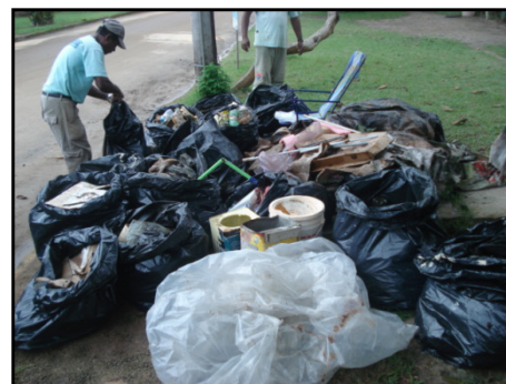
Funcionários da SAI e lixo do pente-fino

Foram recolhidos cerca de 40 sacos de 100 litros de materiais diversos (plásticos, latas, papel, papelão, ferro, etc.), além de cadeiras de praia, varais enferrujados e pranchas de surf danificadas. Isso prova que muitas pessoas ainda precisam ser educadas quanto a destinação correta e manuseio de cada tipo de lixo.