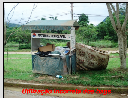
Utilização incorreta dos bags

Dúvidas, críticas ou sugestões? Quer ter seu texto publicado? Mande um e-mail para samigos@uol.com.br