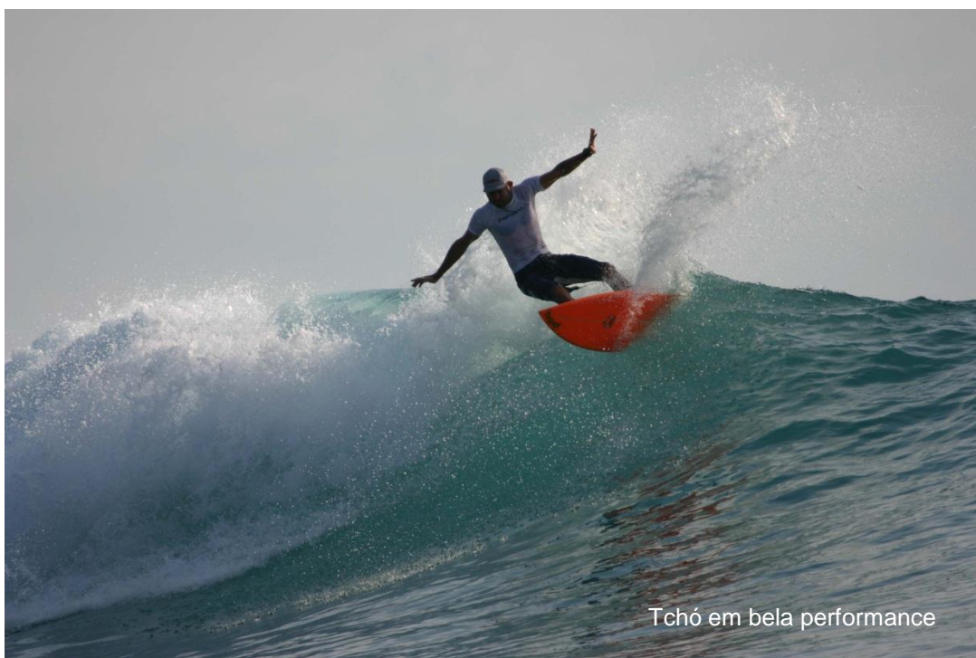
Tchó em bela performance

Alguns não enxergam a importância da SAI para a preservação da praia de Itamambuca. Comecei a frequentar Ubatuba na década de 80, vindo do litoral sul, já em fase de degradação. Avenida à beira mar, roubos de veranistas, ocupações irregulares e daí por diante... Quando cheguei a Ubatuba, costumava ficar na casa de amigos na Praia Grande e no Itaguá. Toda manhã íamos surfar nas praias do norte (Vermelha do Norte, Itamambuca ou Félix) e à tarde era Praia Grande ou Toninhas, mas sempre antes de voltar ao centro, dávamos um mergulho no rio Itamambuca para tirar o sal do corpo. Agora isso não é mais possível, apesar da luta da SAI pela despoluição do rio. Mas poderia estar pior, se a SAI não impedisse a construção de prédios de três andares na entrada de Itamambuca, pois o esgoto desses prédios e a densidade populacional poderiam contribuir ainda mais para a degradação do Rio Itamambuca.