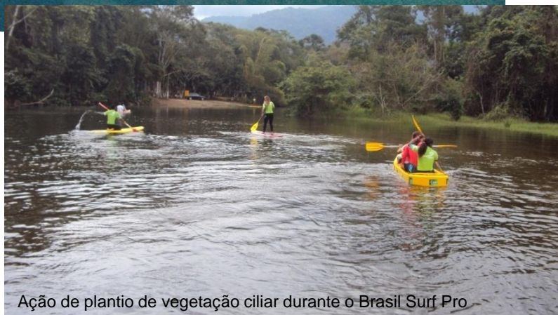
Ação de plantio de vegetação ciliar durante o Brasil Surf Pro

No dia 15/08 foi realizado no Itamambuca Eco Resort um evento para a assinatura, por parte dos candidatos a prefeito de Ubatuba, de um Protocolo de Intenções para com as ações do Plano de Gestão Ambiental - PGA. O evento contou com a presença dos candidatos e demais autoridades convidadas.