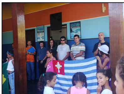
Discurso de abertura da inauguração

A biblioteca funcionará de Segunda a Sexta feira, das 9h às 12h, das 13h às 16h e aos Sábados das 9h as 13h.