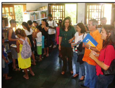
Diretor e professores da escola mostram o espaço