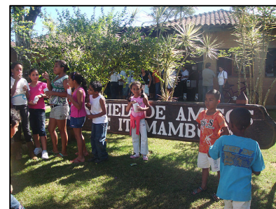
Todos confraternizam após conhecer a biblioteca