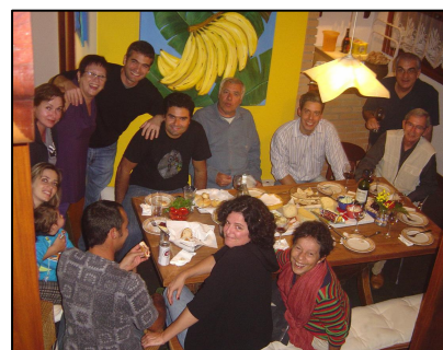
Abib, família e amigos em Itamambuca

Primeiro, por não admitir com a "Lei de Gerson": onde todos usufruem, todos devem custear, sob pena de haver um locupletamento ilícito. Aliás Sérgio Porto (Stanislau Ponte Preta) já dizia: "ou todos nos locupletemos ou que se restaure a moralidade."