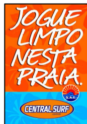
Cartaz da Campanha

A Central Surf em parceria com a SAI marcou presença durante todo o verão na praia de Itamambuca. Essa parceria consistiu na distribuição de sacolas 100% degradáveis e folhetos falando sobre a importância em respeitar o ambiente que você frequenta e outras pessoas vivem. Além disso, a Central Surf forneceu o uniforme para o pessoal da manutenção da SAI, que faz a limpeza da praia. Os resultados da ação foram tão positivos que a empresa resolveu continuar com a distribuição das sacolas e folhetos durante os fins de semana o ano todo, mantendo uma pessoa responsável pela distribuição na guarita de entrada.