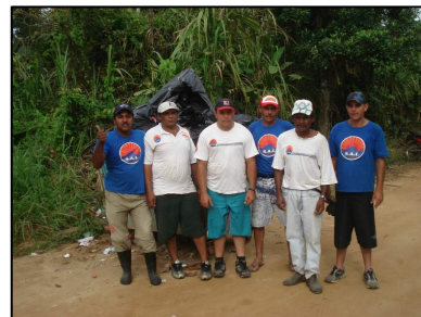
Trabalho pesado no dia 1 de janeiro

No total foram coletados mais de 300 sacos de 100 litros de lixo, deixando a praia muito mais agradável para todos os freqüentadores no dia 1 de janeiro e evitando maiores danos a natureza. Mais uma vez parabenizamos a aplicada equipe de funcionários que trabalhou neste dia das 04:00 às 10:00 da manhã.