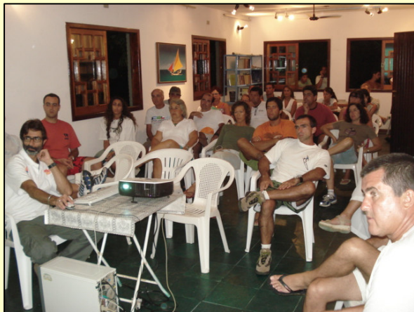
Associados participam da última AGO realizada em 03/02

Conheça a Diretoria e Conselho da SAI eleitos no último dia 03/02: