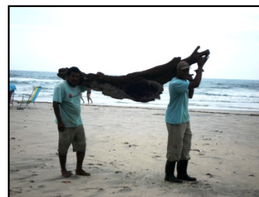
Equipe da SAI retira tronco da praia

A SAI agradece ainda a imensa colaboração do artista plástico Marcelo Maimoni, que já morou em Itamambuca nos anos 90, e é especialista em transformar material orgânico em obras de arte. Conheça mais sobre o trabalho do Marcelo no site http://www.marcelomaimoni.com.br .