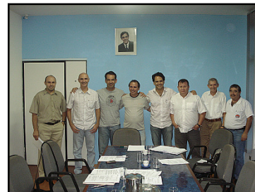
Representantes da SAI e secretários