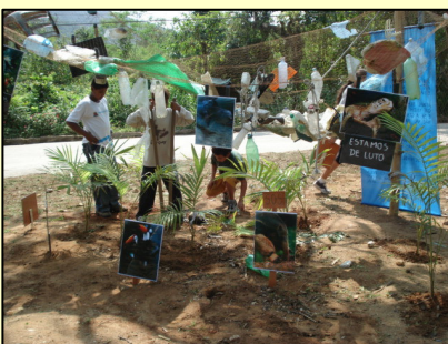
Trabalho de educação ambiental com as crianças