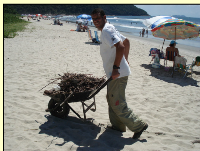
Equipe trabalhando na limpeza diária da praia