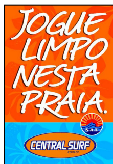
Cartaz da Campanha

A Central Surf em parceria com a SAI marcará presença durante todo o verão na praia de Itamambuca. Essa parceria consiste na distribuição de sacolas 100% degradáveis e folhetos falando sobre a importância em respeitar o ambiente que você frequenta e outras pessoas vivem. Além disso, a Central Surf irá fornecer o uniforme para o pessoal da manutenção da SAI, que faz a limpeza da praia.