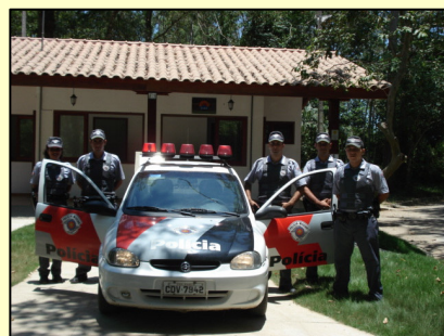
PM e a base construída e mantida pela SAI