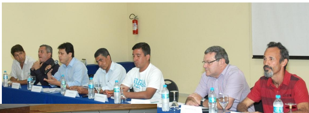
Candidatos à mesa, exposição do PGA e público durante debate

Acesse o link http://www.itamambuca.org.br/?pg=imprensa e veja o Protocolo assinado.