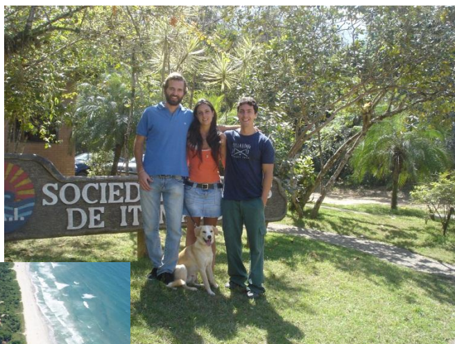
Bacia do Rio Itamambuca, imagem de satélite do rio e equipe que atuará no projeto