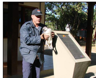
Funcionário da SAI recebe pingüim na Base

A bióloga ressalta que este Pingüim é de origem temperada e não polar. Ele tolera temperaturas de 7 a 30°C, por isso nunca devemos colocar o Pingüim no gelo . Deve-se manter o animal seco e aquecido com uma toalha e jornal e, depois de seco, abrigá-lo em uma caixa de papelão com cobertor e acionar o resgate. Estes animais chegam às praias em estado de hipotermia (baixa temperatura corpórea), por isso as primeiras ações para o aquecimento do animal são fundamentais para sua sobrevivência.