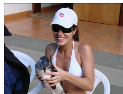
Bióloga providencia cuidados para o animal