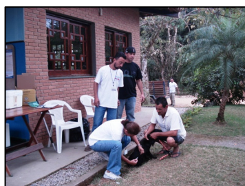
Animais são vacinados contra a raiva