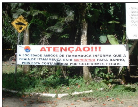
Faixa na entrada do loteamento alertando os visitantes