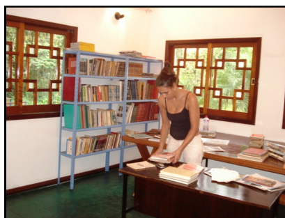
Professora da escola organiza a biblioteca

Agradecemos as doações de livros novos e usados que temos recebido para a biblioteca comunitária instalada na sede da SAI voltada para os alunos da Escola Municipal Honor Figueira.