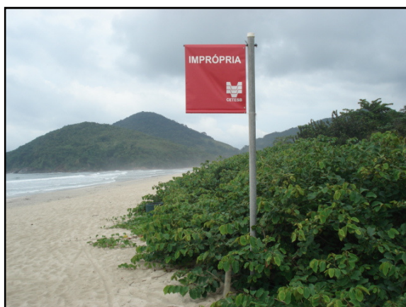
Bandeira Vermelha da CETESB indicando mar impróprio

A SAI está alertando a todos os visitantes e proprietários sobre os riscos com a colocação de faixas e distribuição de folhetos informativos.