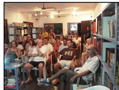
Associados participam da AGO

a aquisição e estocagem de bica graduada para manutenção das ruas; a contratação de local para vazamento do lixo verde das áreas comuns e das casas; troca de placas e lixeiras danificadas das ruas e praia. Além disso, é importante ressaltar que ocorreram em 2009: a colocação dos bancos na trilha da avenida; a instalação de bicicletários na entrada do loteamento; a inauguração da Biblioteca “Aldemar José de Freitas”. Em 2010, a vigilância deverá ter um aumento de 2 pessoas no quadro; a compra de 2 rádios e 3 novas motos; a ampliação da capacidade de armazenamento de imagens das câmeras para 30 dias. A manutenção deverá ter: aumento de 1 pessoa na equipe; aquisição de 2 novas roçadeiras e uma moto-serra leve. Estão previstas também para este ano: a aquisição de aparelhos e instalação da “Estação da Terceira Idade”; a construção de uma base centralizada para lixo reciclável e aquisição de novas caçambas.